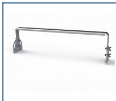
Кронштейн Лира Unit 120 (комплект)